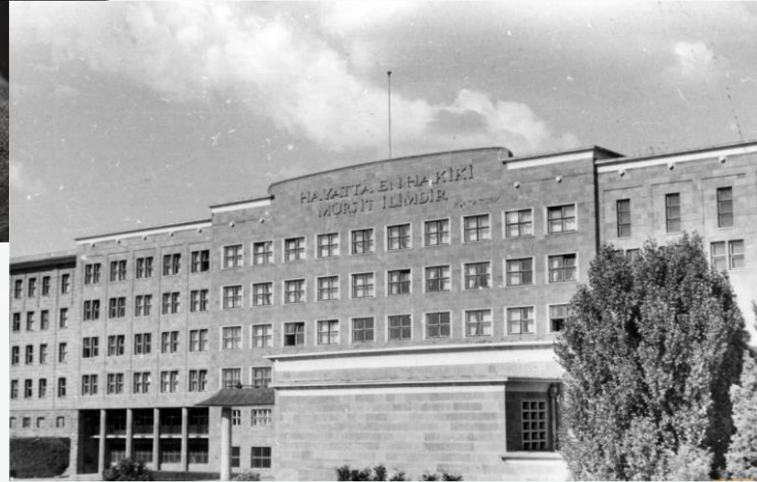
DİL TARİH COĞRAFYA FAKÜLTESİ